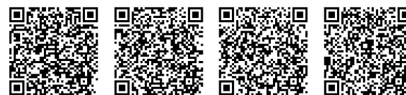
FOCUS École Polytechnique FOCUS ENSTA Paris FOCUS ENSAE Paris FOCUS Télécom Sud Paris