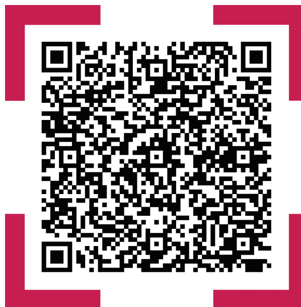
FOCUS Télécom Paris